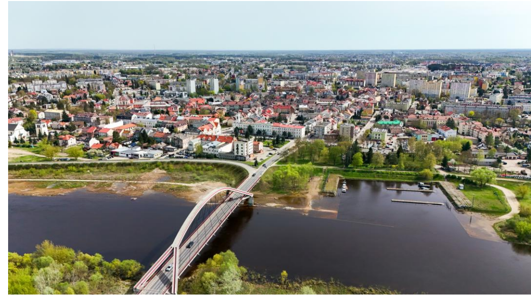
photo : Pont du général A. Madaliński sur la rivière Narew

Ostrołęka est également connue pour son industrie papetière , qui a construit ses fondements économiques pendant des décennies et a constitué l'emblème de la ville. C'est grâce à elle qu'Ostrołęka a pris une place importante sur la carte de l'industrie polonaise et que les générations successives d'habitants ont lié leur vie professionnelle à ce secteur économique.