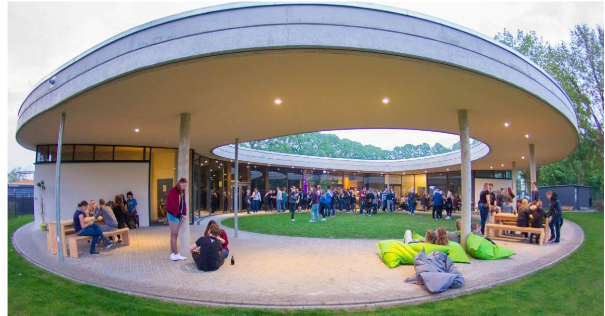
L'inspiration pour le Centre pour la jeunesse vient de la ville jumelée d'Ostrołęka, Mappen en Allemagne

Budget total du projet : 76 027 720,00 CHF) PLN (16 895 049,00 CHF)