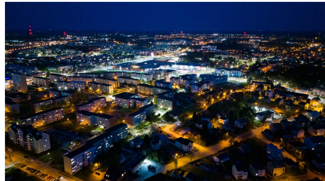
photo : Panorama d'Ostrołęka la nuit