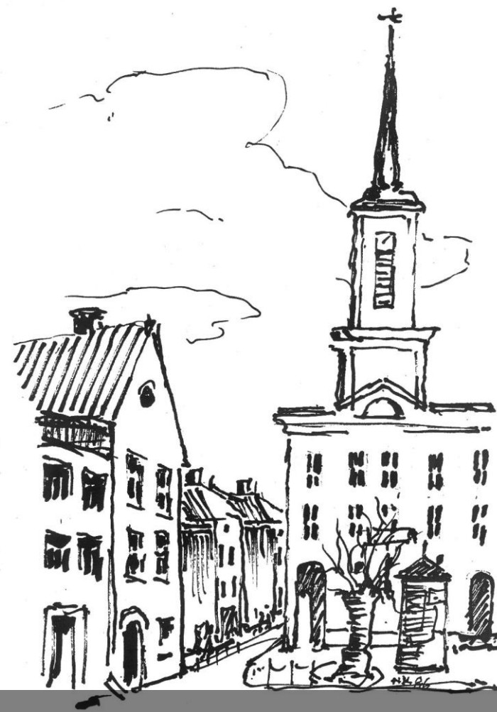
dessin : Henryk Krauze – Hôtel de ville d'Ostrołęka